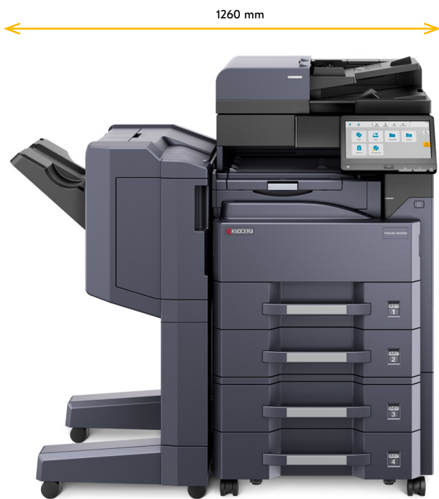
DP-7150 PF-791 DF-7120 + AK-740