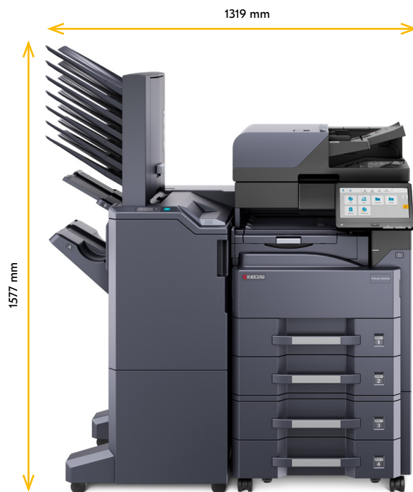
DP-7160 PF-791 DF-791 + AK-740 MT-730(B)