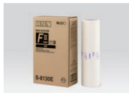
MASTER RISO Type FIL (A3 : 220 feuilles)

Le symbole RISO i Quality garantit la compatibilité avec RISO i Quality System.