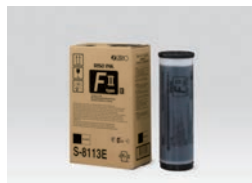
ENCRE RISO Type FIL noire (1000ml)