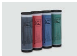
ENCRE RISO Couleur Type FIL (1000ml)